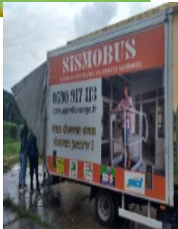
Ci-contre, le sismobus (simulateur de séismes)