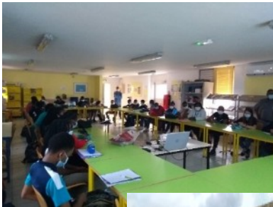
Ci-dessus, la Seconde 10, lors de la conférence au CDI.

M.PARAT Jérôme, coordonnateur au Lycée de l'exploitation de la station Météo